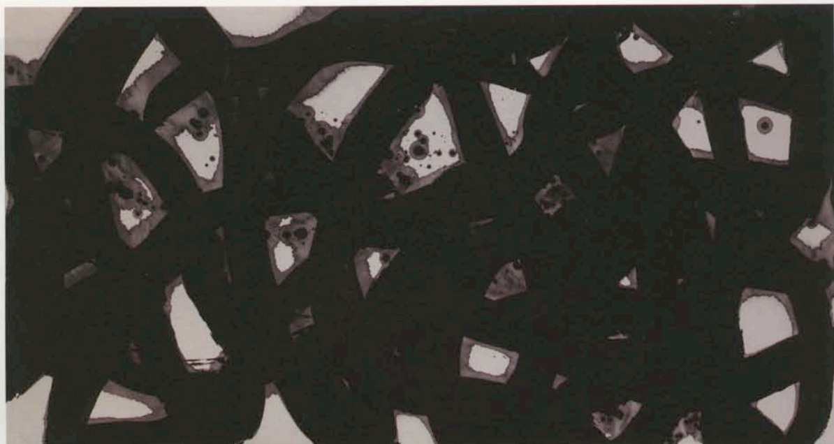
王冬龄作品，王冬龄更趋向于抽象绘画而非书法，他强调书写作为一种重要的表达方式，展现艺术与身体的关联。他实验性地运用指尖、手腕、胳膊及整个身体创作水墨作品。 王冬龄 / 《元吉》2013年 / 纸本水墨 / 96×180cm