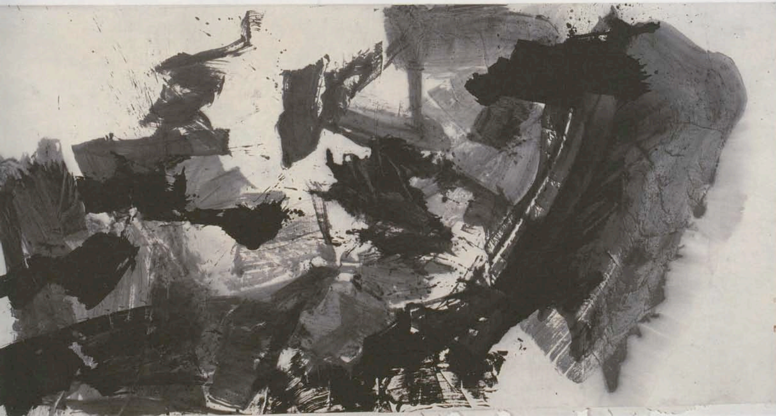
蓝正辉作品， Leap series No.4。蓝正辉受其理工背景的影响，他的的审美灵巧地游走于理智和感性世界。其抽象风格更突出了水墨自身的意义，伴随着系统精妙的身体运动，作品的视觉和精神冲击力与肌肉、热血、体力一起膨胀。 蓝正辉 / 《跃式系列之四》2010年 / 宣纸水墨 / 245×500cm