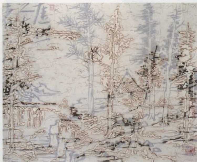
王天德作品。他在宣纸上烧出类似汉字的符号。 烧焦的痕迹，形成的形状和空间，使其看上去类似山水景观。 王天德 / 《数码 No10 - SA - 42(a) (b)》2010 年 / 宣纸、皮纸、墨、焰 / 41.5×51cm×2