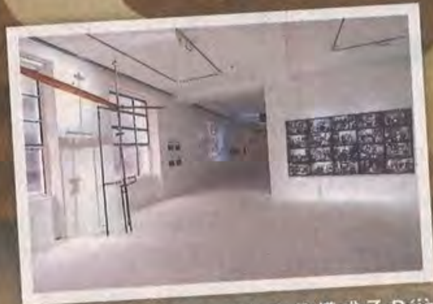
四位藝術家九十年代的作品構成了 Déjà Disparu，一個關於城市景觀的當代藝術展