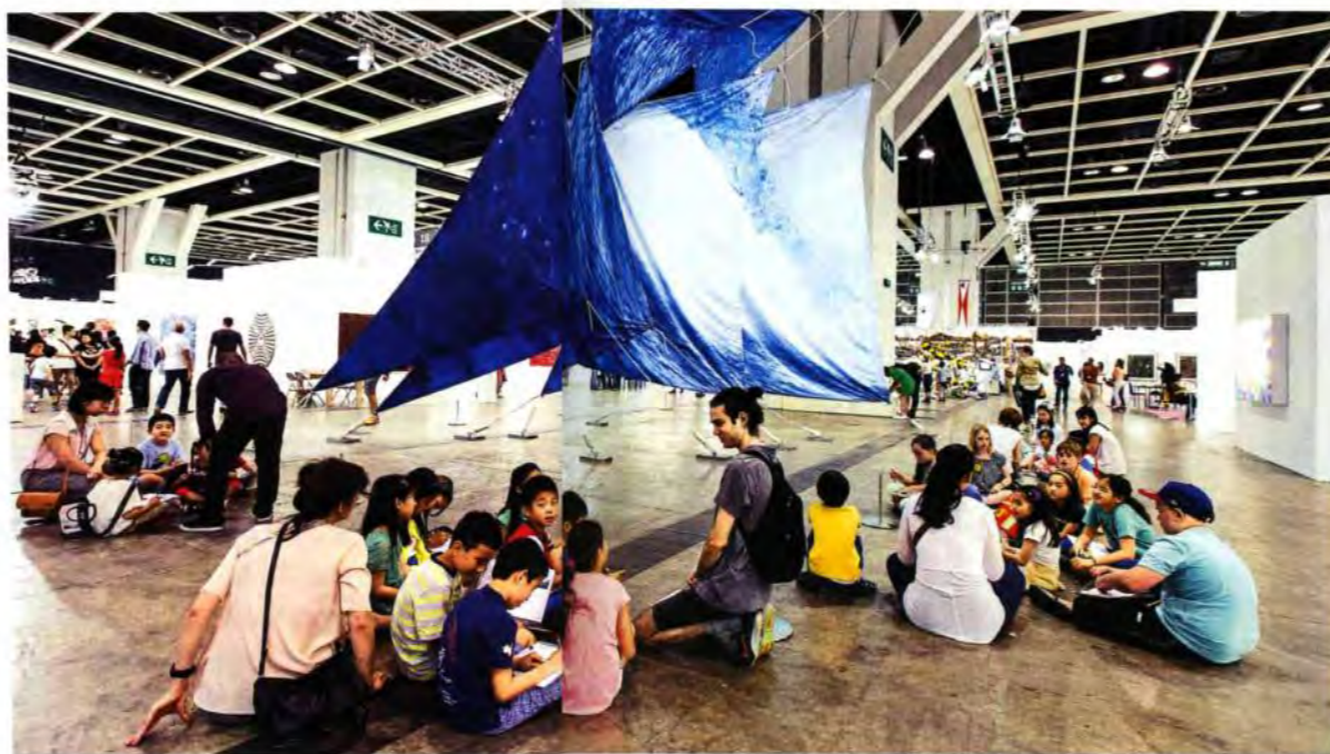
当代唐人艺术中心战区。

佳士得艺术空间在周二的晚上趁势举办了一场日本当代艺术的展览，苏富比香港和保利香港也都有展览呈现。国际知名画廊聚集的中环，则是访港不容错过的必访之地：毕打行从三层到七层一层层一家家参观，精彩不断。高古轩“无尽的贾科梅蒂”持续到5月底，艺术门画廊推出苏笑柏的新个展，汉雅轩呈现了在巴塞爾风头颇高的谷文达的个展，临近的香港佩斯展示张晓刚的一系列小幅新作，农业银行大厦的白立方展出洛杉矶艺术家马克·布拉德福德的最新作品展，K11艺术基金会 pop-up 空间带来张恩利的个展“空间绘画”，“青年艺术100”则在K11的中庭立起了巨大的“功夫熊猫”，引来不少人拍照，还有G层和地铁层的K11购物艺术馆展出了一系列青年艺术家的作品，又一次强调了“青年决定未来”。