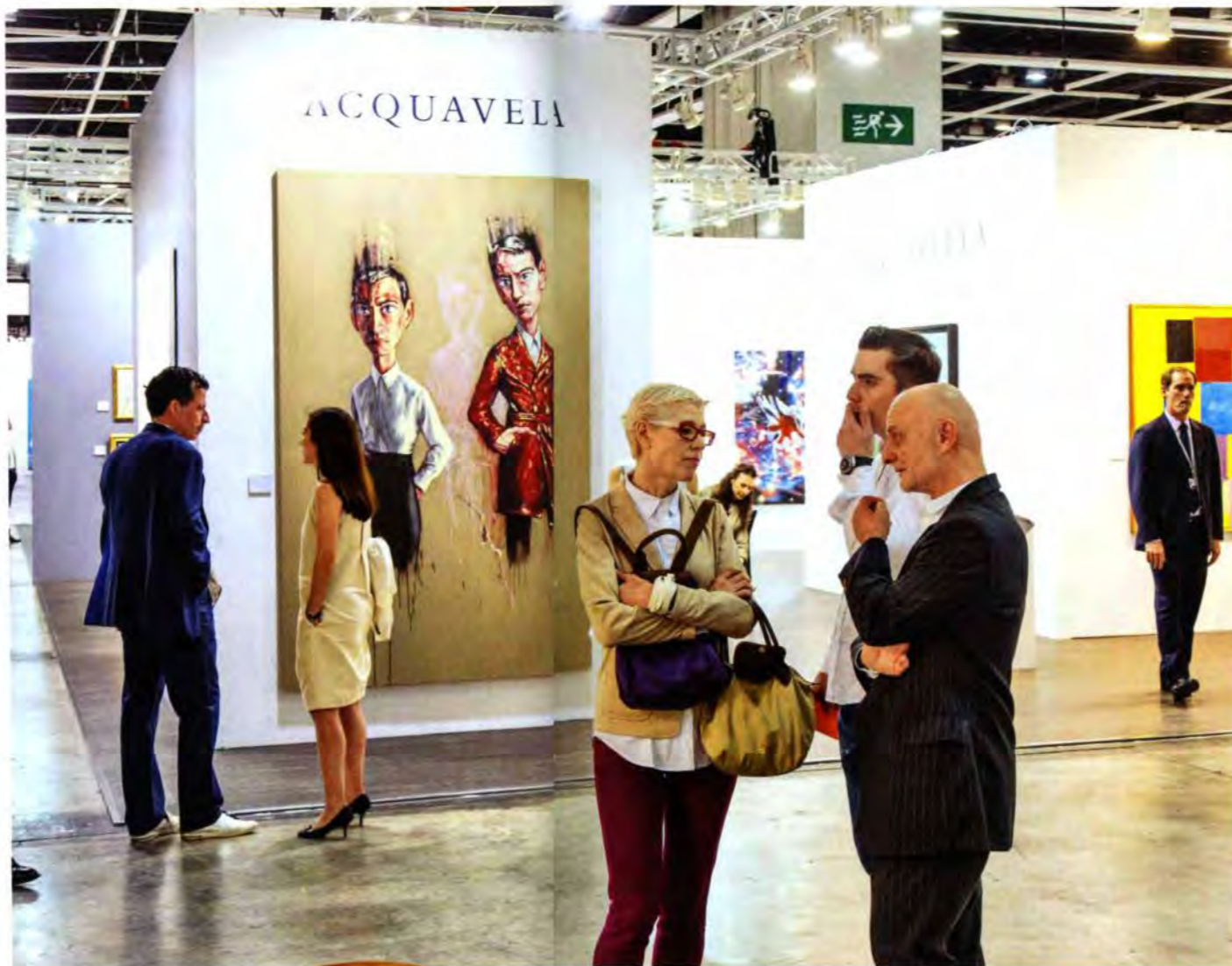
纽约 Acquavella 画廊以300万美元售出了曾梵志的《面具》。

有媒体调查称，本届展会单件作品成交额达到10万元人民币以上的作品多是中国内地及香港的画廊，或是在香港设有空间的画廊，或是有代理中国艺术家的国外画廊。签约海外画廊的中国艺术家的表现不错：豪瑟和沃斯画廊（Hauser & Wirth）卖出了10幅张恩利的作品，其中《The Branch》和《Tension 1》均以21万美元成交；纽约 Acquavella 画廊的曾梵志的《面具》，以300万美元售出。一层正对A口的 Rhona Hoffman 画廊，以6万美元的价格售出了王庆松的一张摄影作品。此外一些迎合中国市场口味的作品，反响也不错，例如白立方画廊带来的达明·赫斯特的作品《北京》，用刀片组成的北京城区俯瞰图，十分迎合内地藏家的认知和趣味，根据预展现场画廊主乔普林的透露，当天就以130万美元成交。正像许多媒体点出的“亚洲”主题一样，亚洲的藏家特别是中国的藏家还是更偏爱符合自身文化背景的作品，也许这就是“亚洲趣味”。