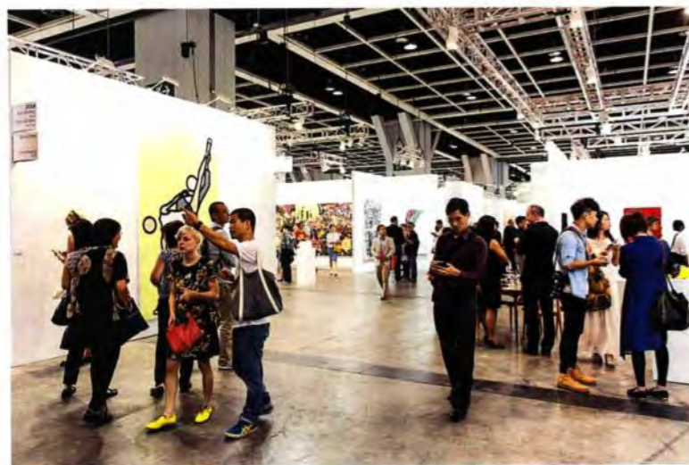
五天的展期吸引来近七万人次访问。