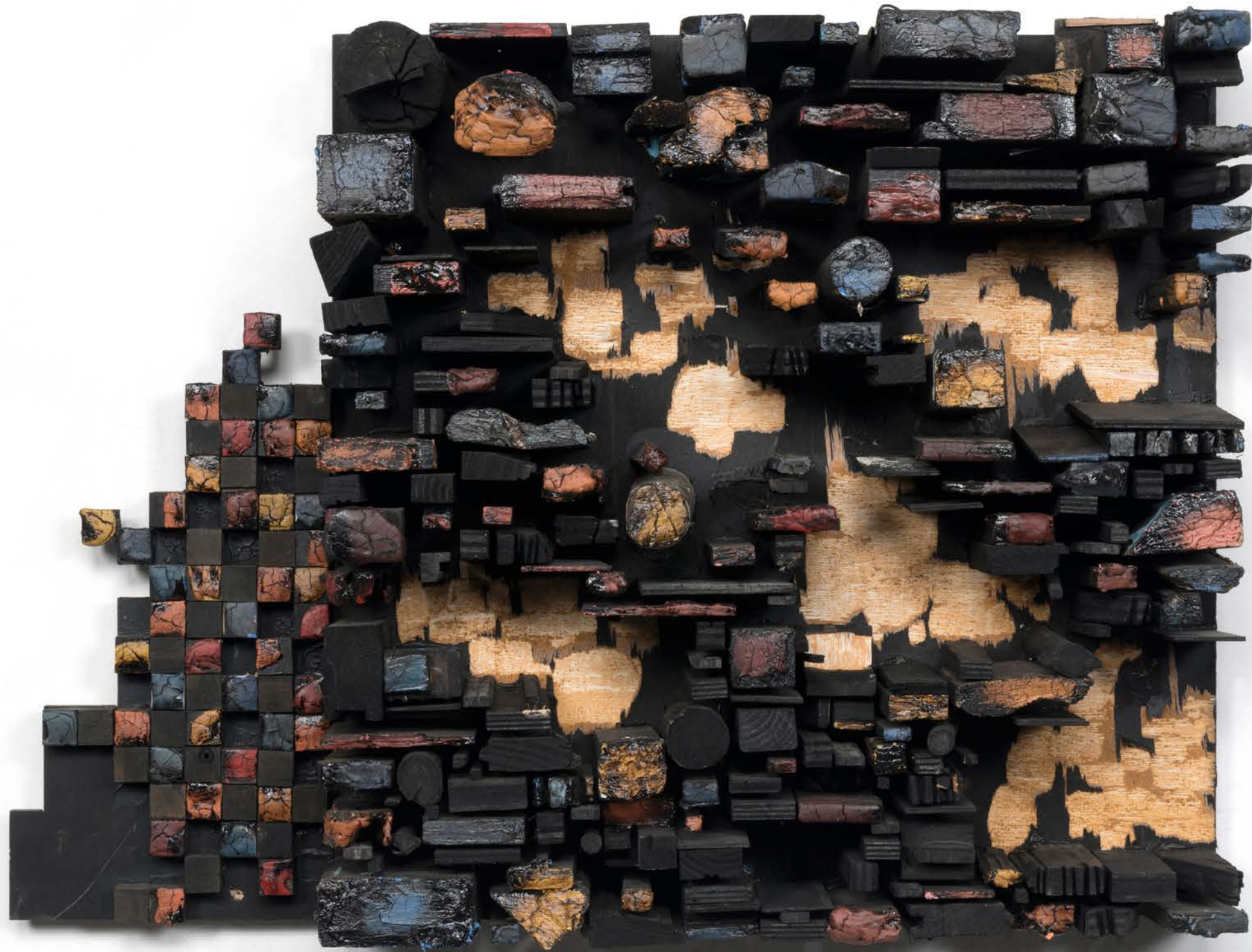
Number 15C 数字15C, 2015, Wood, paint and screws 木材、顏料和螺絲, 83 x 61 x 14 cm (32 5/8 x 24 x 5 1/2 in.)