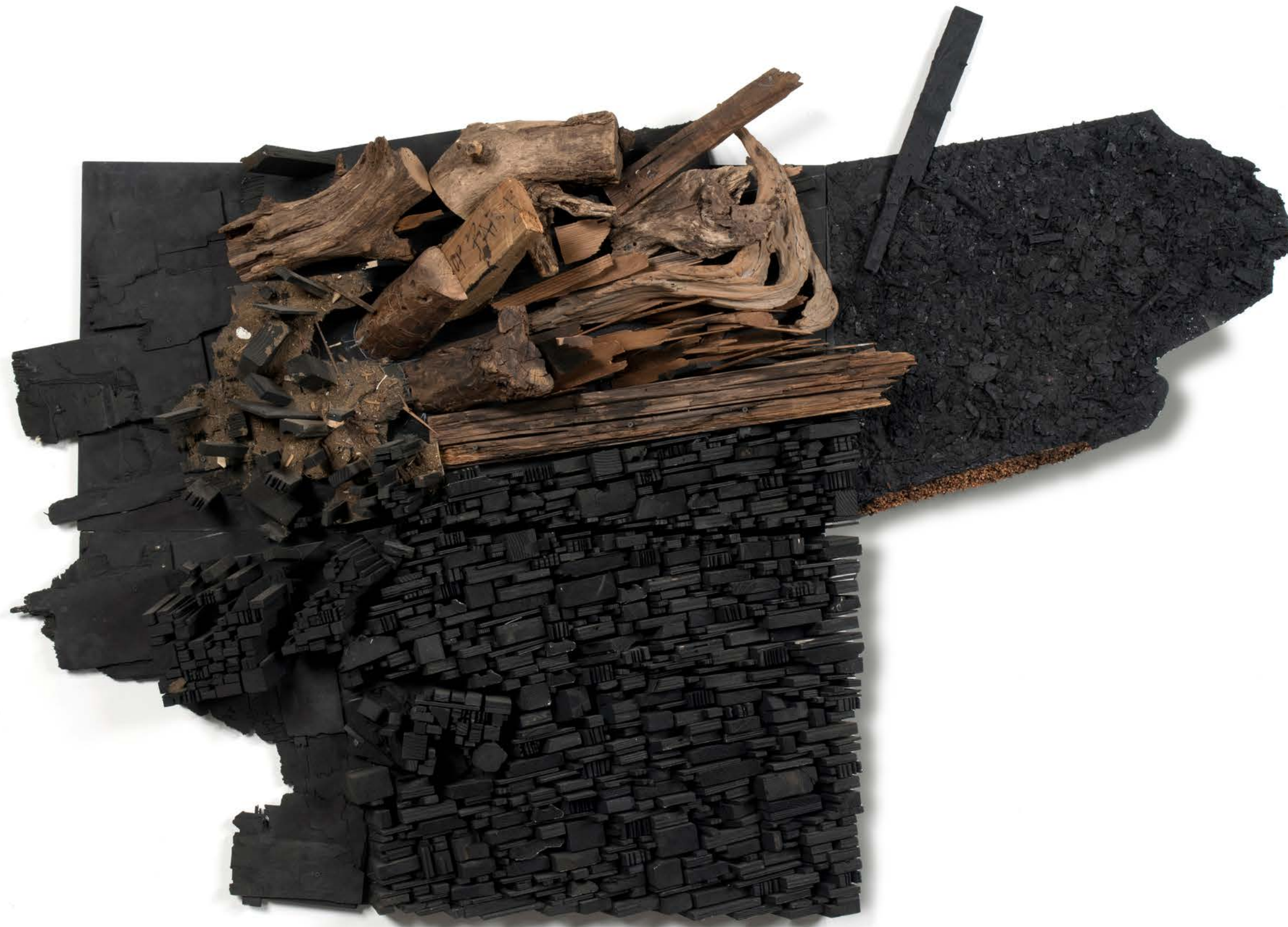
Number 18C 数字18C, 2015, Wood and paint 木材和顏料, 216 x 147 x 37 cm (85 x 57 7/8 x 14 5/8 in.)