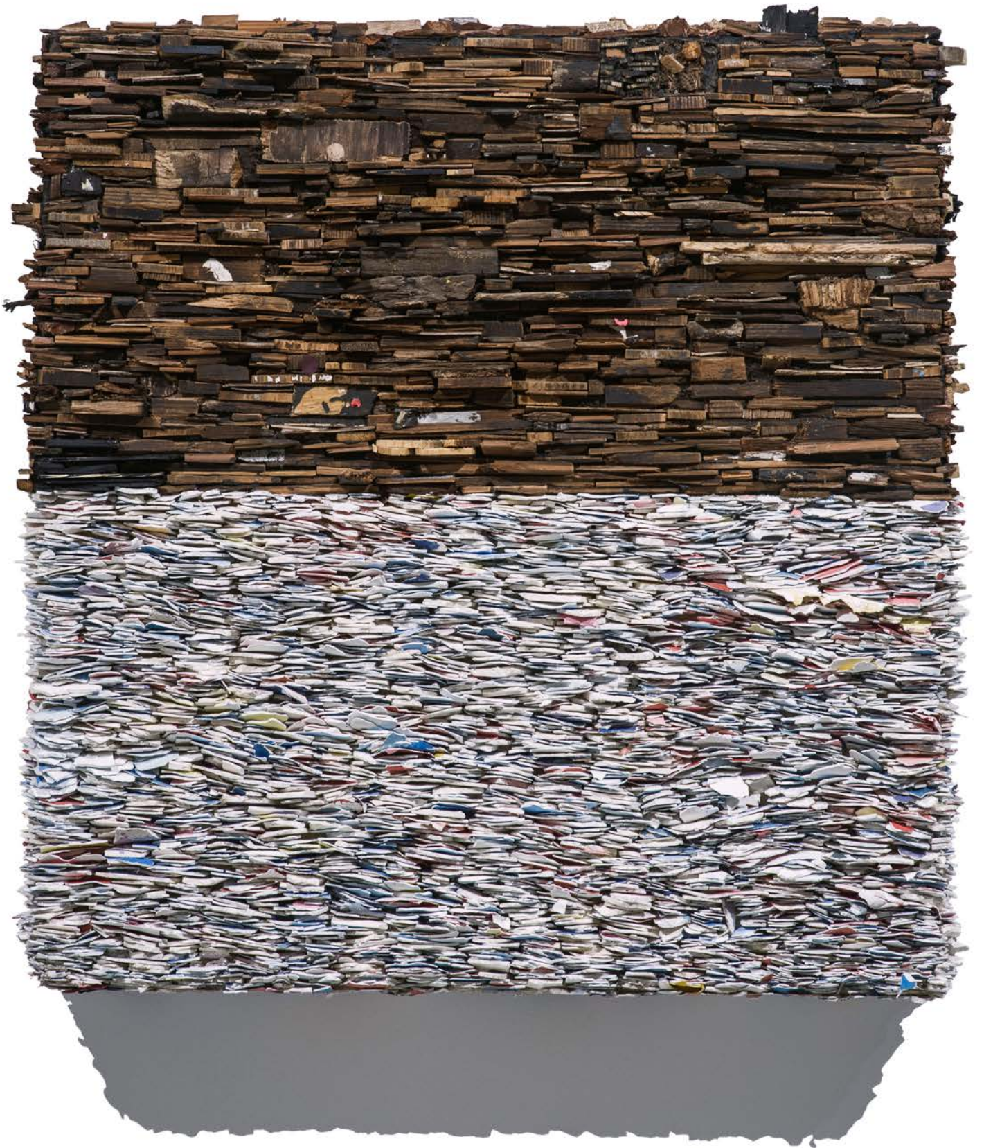
Number 11C 數字11C , 2015, Wood and paint chips 木材和漆片, 65 x 64 x 13 cm (25 5/8 x 25 1/4 x 5 1/8 in.)