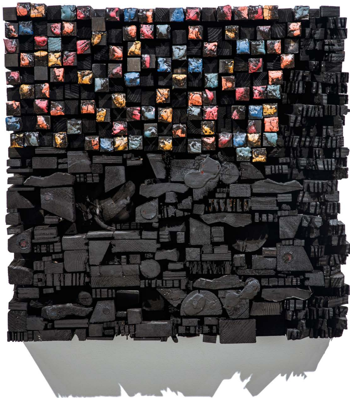
Number 16C 數字16C , 2015, Wood, paint and screws, 木材、顏料和螺絲, 63 x 61 x 14 cm (24 3/4 x 24 x 5 1/2 in.)