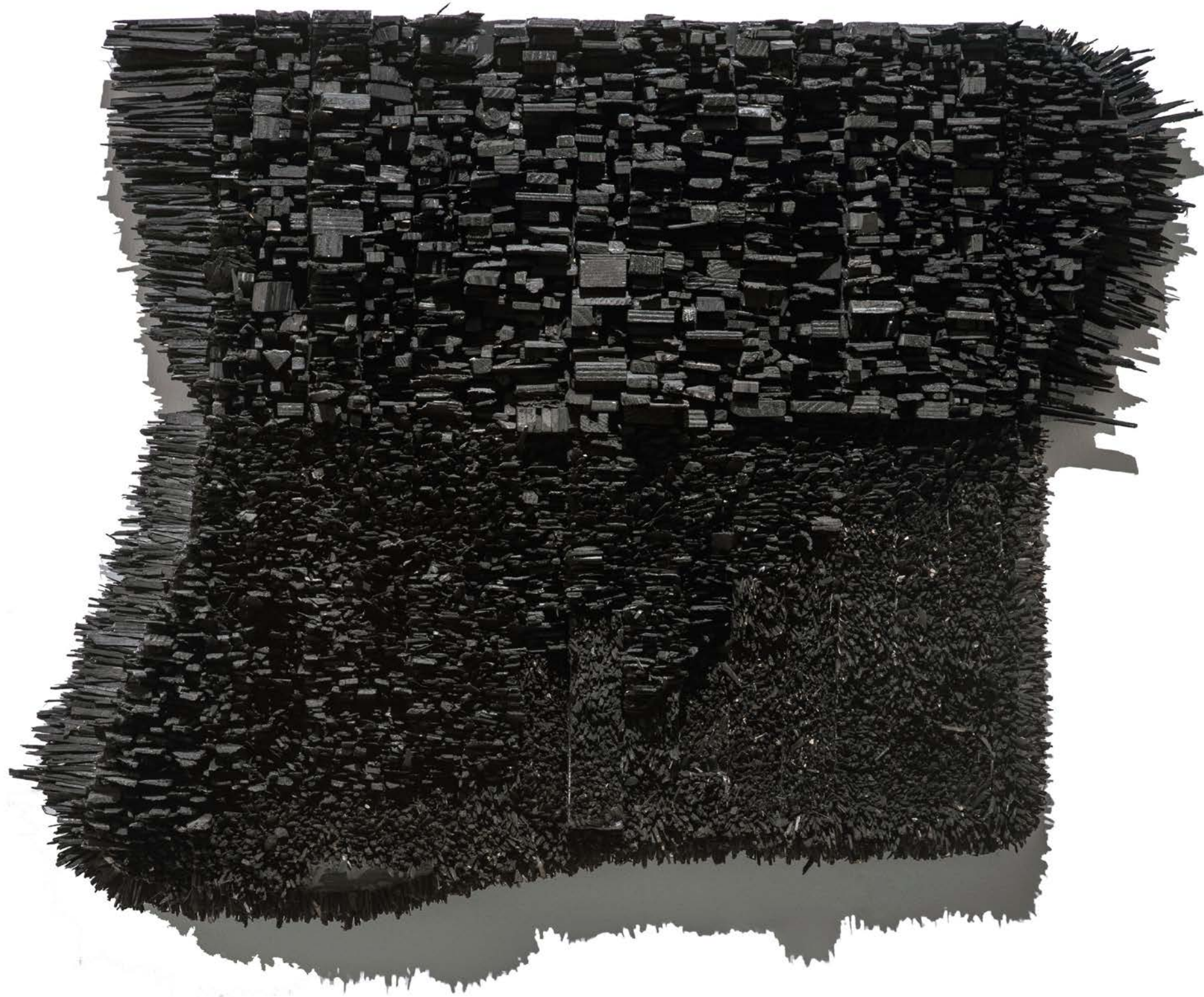
Number 17C 數字17C, 2015, Wood and paint 木材和顏料, 86 x 66 x 15 cm (33 7/8 x 26 x 5 7/8 in.)