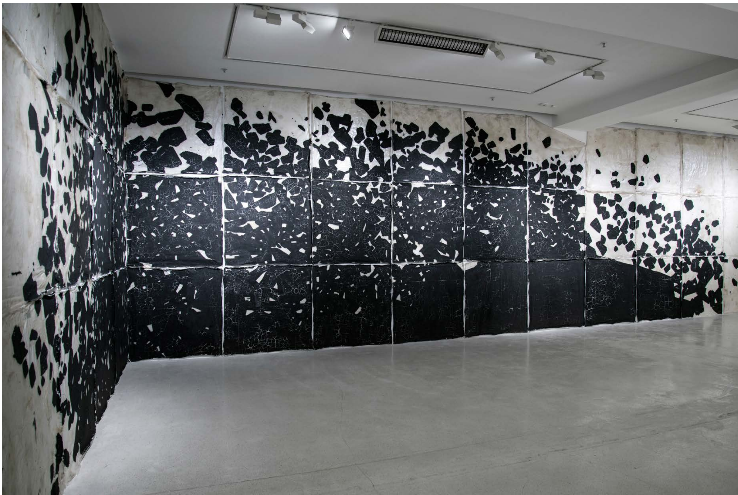
Number 21C 數字21C , 2015, Mixed media, wood, paint, and glue 混合媒材、木材、顏料、胶粘剂, Dimensions variable 尺寸可變