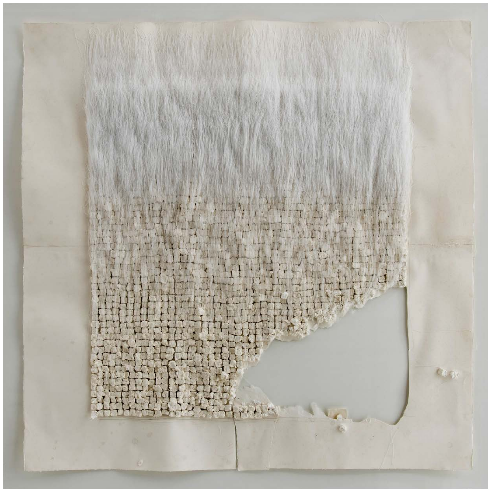
Number 19C 数字19C , 2015, Cast paper and thread on paper 紙上鑄塗紙和線, 107 x 105 x 11 cm (42 1/8 x 41 3/8 x 4 3/8 in.)