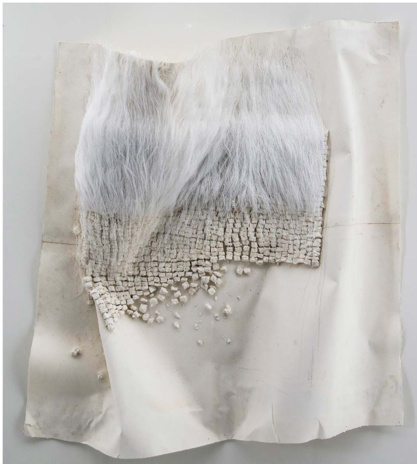
Number 20C 数字20C, 2015. Cast paper and thread on paper 紙上鑄塗紙和線, 96 x 107 x 32 cm (37 3/4 x 42 1/8 x 12 5/8 in.)