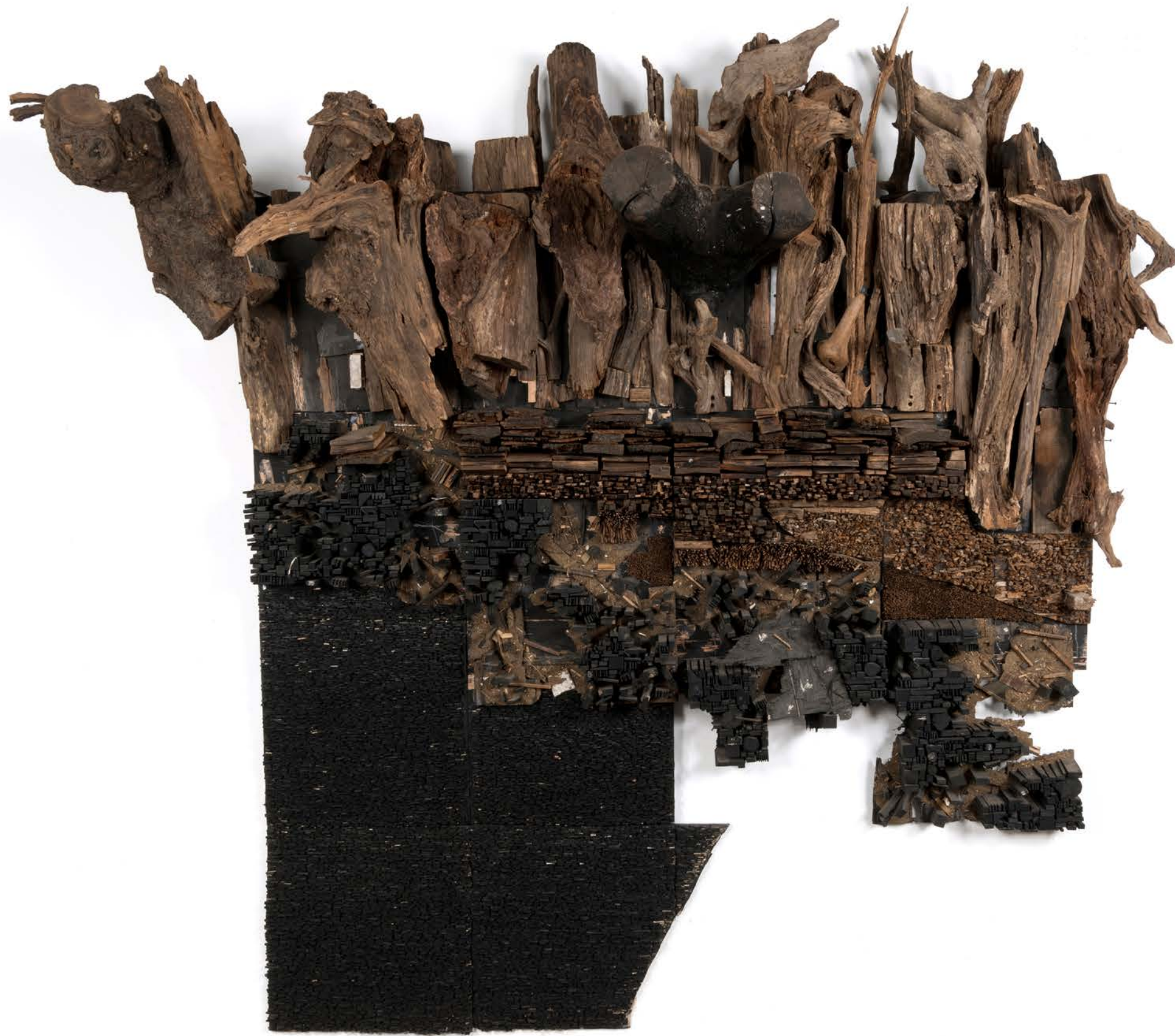
Number 9C 数字9C, 2015, Wood and paint 木材和顔料, 312 x 287 x 92 cm (122 7/8 x 113 x 36 1/4 in.)