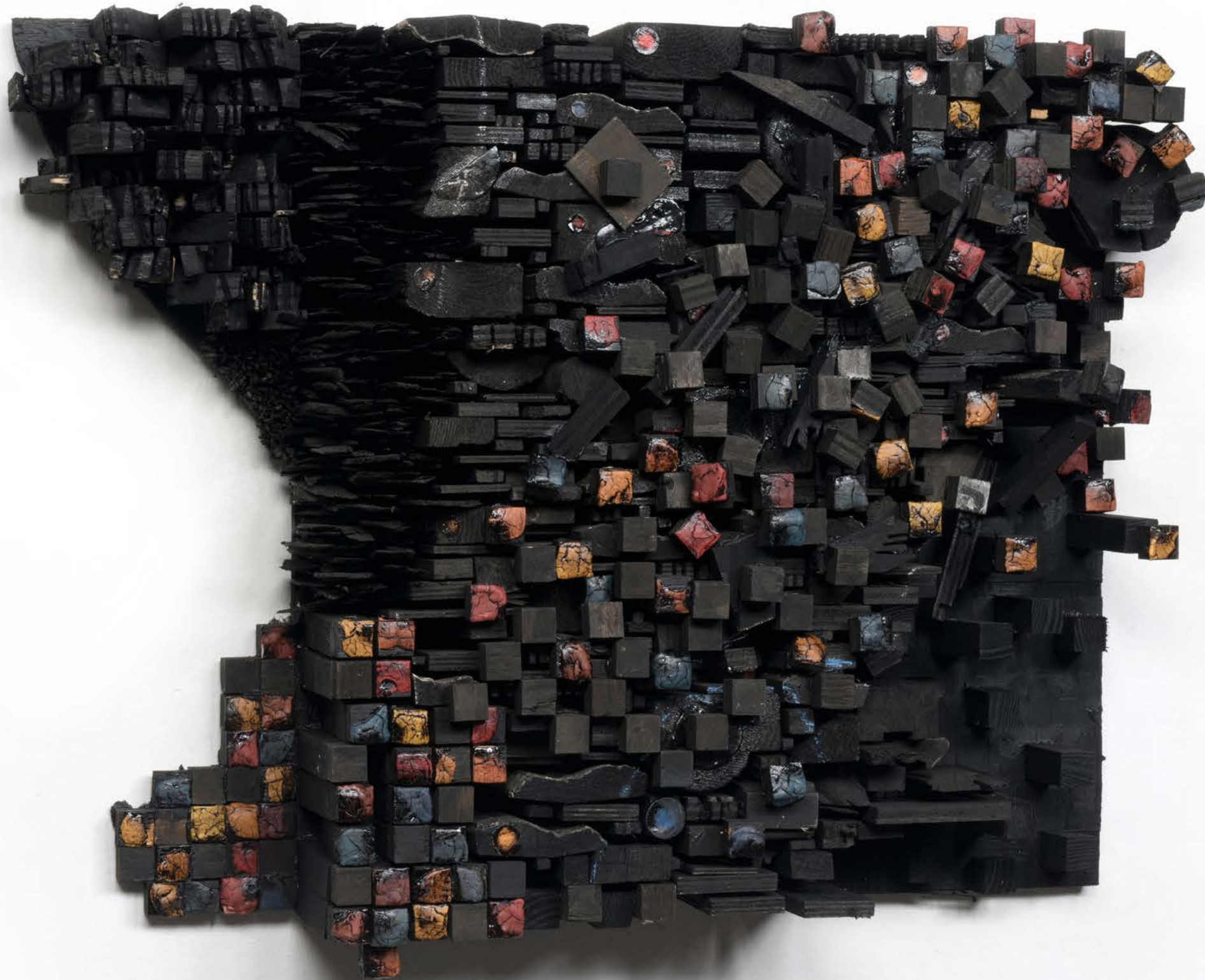
Number 14C 数字14C, 2015, Wood, paint and screws 木材、顏料和螺絲, 89 x 64 x 18 cm (35 x 25 1/4 x 7 1/8 in.)