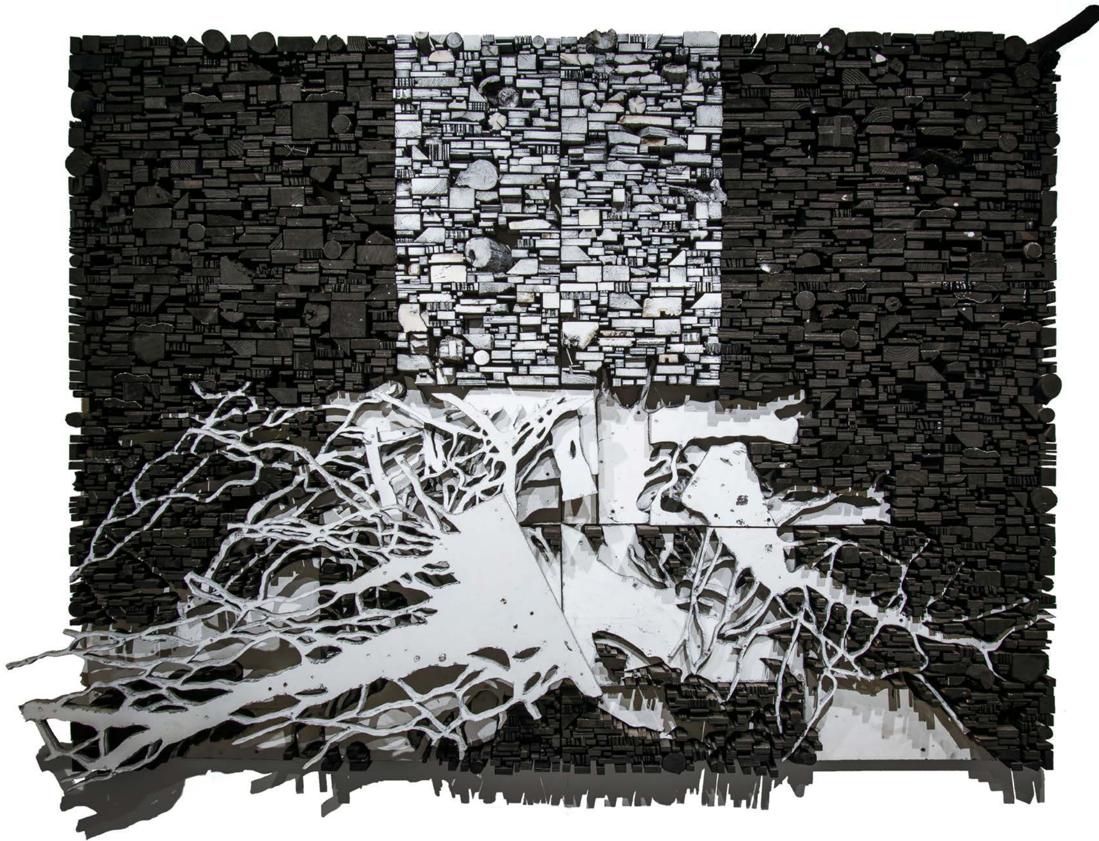
Number 13C 數字13C, 2015, Wood, paint, and screws 木材、顏料和螺絲, 261 x 214 x 20 cm (102 3/4 x 84 1/4 x 7 7/8 in.)