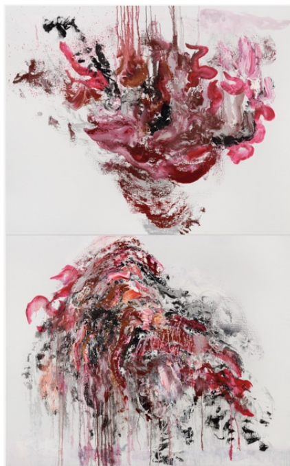
瑪吉·漢布林 b. 1945, 英國, 將吻, 2023, 布面油畫, 雙聯畫, 每幅121.9 x 152.4 cm (48 x 60 in.)

展覽日期 2024年3月26日至5月16日，星期一至星期六（上午10時至晚上7時） 地點 藝術門，香港中環都爹利街6號印刷行地下及地庫