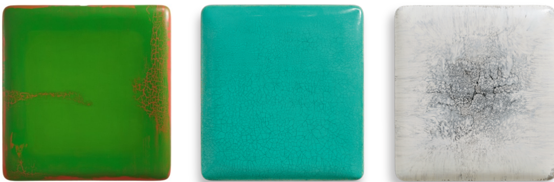
左：蘇笑柏 b. 1949, 寬厚-萬綠, 2015, 油彩、大漆、麻布、混合水、木板, 190 × 182 × 14 cm (74 3/4 × 71 5/8 × 5 1/2 in.) 中：蘇笑柏 b. 1949, 珍物, 2025, 油彩、大漆、麻布、混合水、木板, 165 × 164 × 18 cm (65 × 64 5/8 × 7 1/8 in.) 右：蘇笑柏 b. 1949, 仰慕, 2025, 油彩、大漆、麻布、混合水、木板, 175 × 168 × 16 cm (68 7/8 × 66 1/8 × 6 1/4 in.)

藝術門榮幸宣布畫廊藝術家蘇笑柏的個展《蘇笑柏的鍊金宇宙》將作為第六十一屆國際藝術展——威尼斯雙年展的官方平行活動呈現。此次展覽由蘇笑柏基金會攜手洛杉磯郡立藝術博物館（LACMA）聯合呈現，由洛杉磯郡立藝術博物館（LACMA）中國藝術部策展人兼中國、韓國與南亞及東南亞藝術部主任史蒂芬·利特爾（Stephen Little）策劃，建築師庫拉帕特·揚特拉薩斯特（Kulapat Yantrasast, WHY建築事務所）擔任空間設計，以前所未有的方式全面梳理並呈現蘇笑柏的創作實踐。